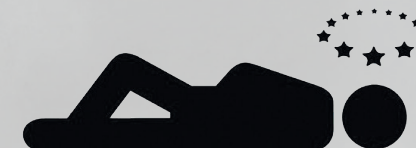
загуба на съзнание LOSS OF CONSCIOUSNESS